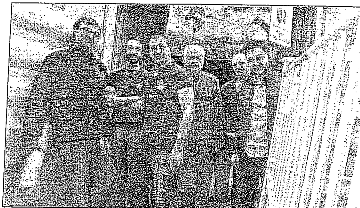
Plus de 80000 euros de matériel médical et scolaire sont embarqués par fret pour le Togo.

1. Ont participé à l'opération: la Mutualité française PACA, service de soins et d'accompagnement mutualiste, PACA Afrique solidarité, La Ligue de l'enseignement PACA et le crédit Mutuel.